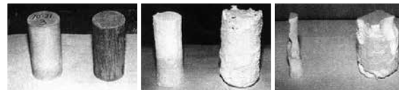
Avant Immersion Après 5 semaines Après 10 semaines

Des cylindres traités au Xypex et non traités ont été exposés à de l'acide chlorhydrique, de la soude caustique, du toluène, de l'huile minérale, du glycol éthylnique, du chlore de piscine, du fluide de freins et autres produits chimiques. Les résultats de ces tests ont indiqué que l'exposition à ces produits chimiques n'a eu aucun effet nocif sur l'enduit Xypex. Des tests effectués suite à l'exposition aux produits chimiques ont indiqué une augmentation moyenne de la résistance à la compression de 17% sur les échantillons traités au Xypex, comparativement aux échantillons non traités.